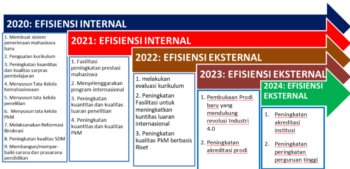
Gambar 2.1 Roadmap STMM Tahun 2020-2024

Rencana Strategis STMM Yogyakarta merupakan penjabaran serta tindak lanjut dari Renstra Badan Pengembangan Sumber Daya Manusia Kominfo. Guna mempermudah pencapaian kinerja telah disusun Roadmap STMM tahun 2020-2024. Dalam roadmap ini telah ditetapkan hal-hal yang akan dicapai serta indikator yang perlu diselesaikan dalam kurun waktu 5 (lima) tahun kedepan guna mencapai Visi dan Misi yang telah ditetapkan.